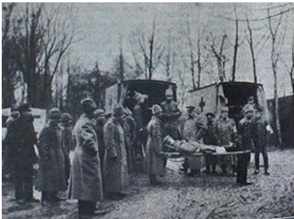
(рос. Переноска раненных в санитарный поезд. Родина. 1915. №21. С. 270.)