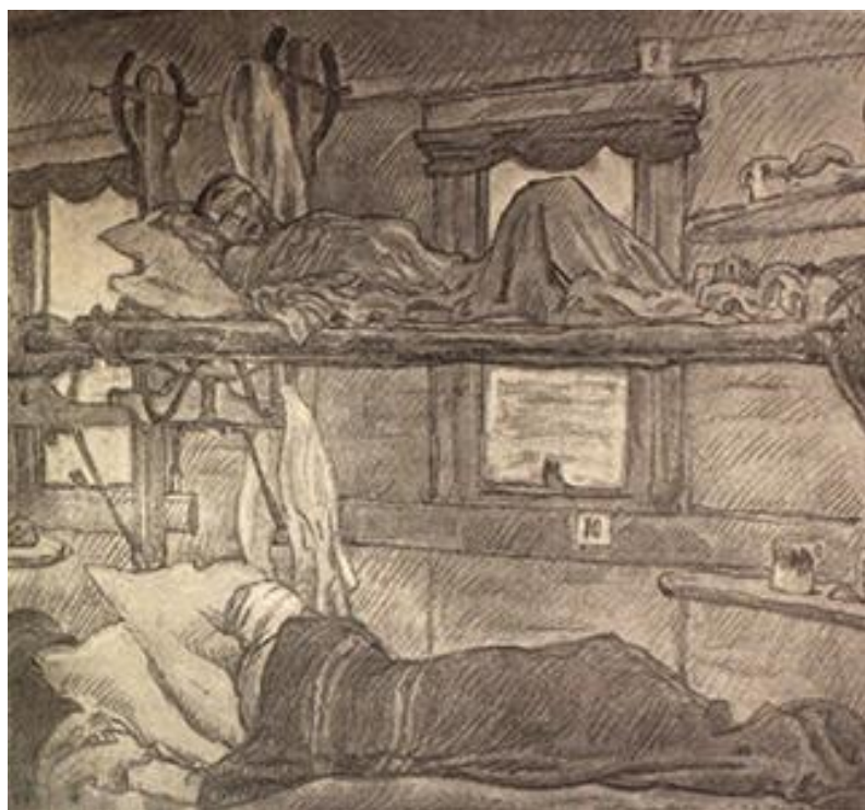
(рос. Раненные в вагоне. Из пут. альб. худ. М.Добужинского.)

Джерело: http://vvmirv.shpl.ru/dokum.html